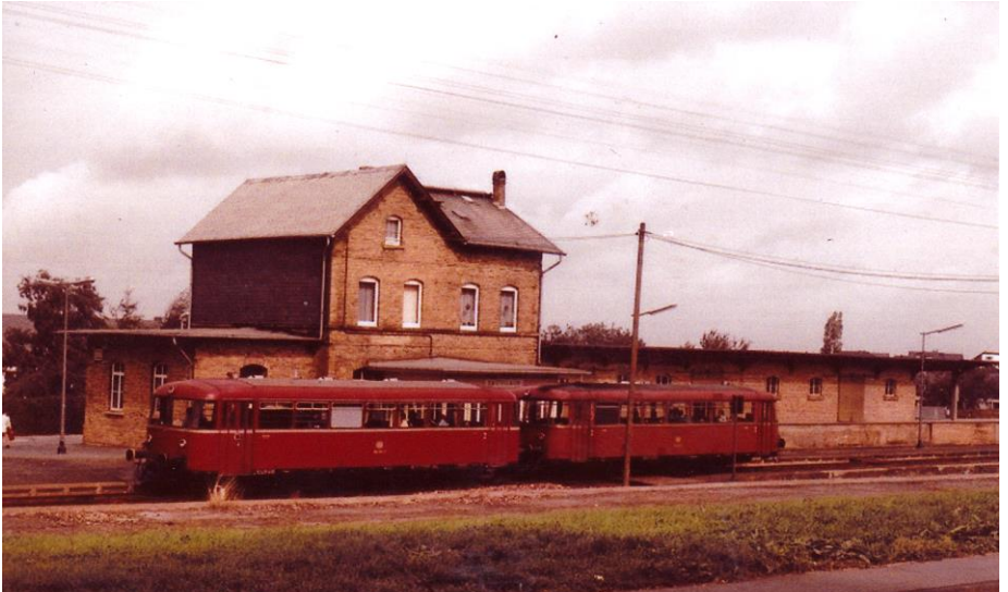
Ein Schienenbus vor dem Kastellauner Bahnhof